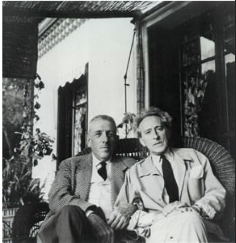
"Poupoule" et Jean Cocteau (circa 1950)

Les mélodies de Francis Poulenc, ce sont aussi et bien sûr des poèmes, toujours pré-existants à la composition. « C'est avec Apollinaire que je pense avoir trouvé mon véritable style mélodique » écrit-il, et ce pan de sa musique est née de cet amour gourmand de la poésie et de l'amitié pour ses amis poètes. L'équilibre entre mots et musique est d'une justesse précieuse et émouvante.